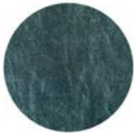
METAL VERDE SCURO