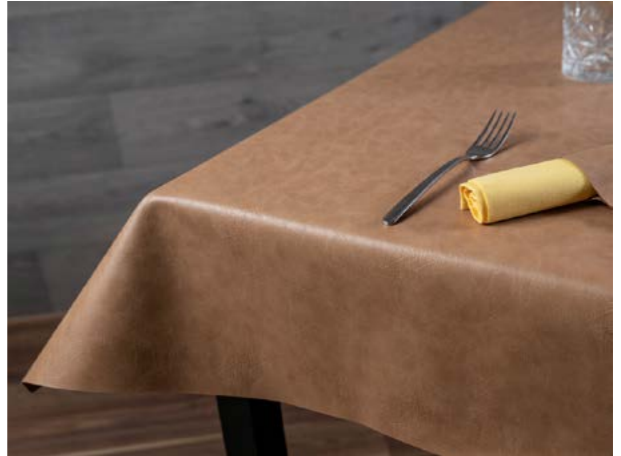
Tovaglia con cadute laterali