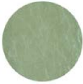
METAL VERDE CHIARO