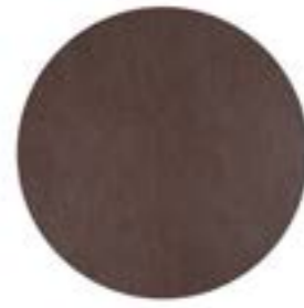
COLOUR TESTA DI MORO